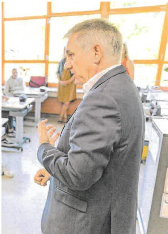
wird uns auch die nächsten Jahre beschäftigen.»