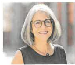
Kathrin Scholl, Präsidentin des Lehrerinnen- und Lehrerverbandes.

werden, weiss niemand, doch das Problem ist eigentlich nicht gelöst. Dort, wo niemand gefunden werden konnte, hat man Klassen zusammengelegt. Das ist für uns Lehrerinnen und Lehrer eigentlich kein gangbarer Weg, denn durch die Klassengrösse wird die Lehrperson am stärksten belastet. Das muss eine absolute Notlösung bleiben.